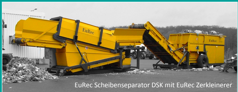
EuRec Scheibenseparator DSK mit EuRec Zerkleinerer

Entwickelt zur Trennung der Organik aus dem Stoffstrom besonders bei sehr hohem, feuchten Organikanteil oder bei Aufbereitung von Altdeponien, nahezu verstopfungsfreies Absieben auch schwieriger Abfälle. Abscheiderate bis zu 90 % der sich frei im Stoffstrom befindlichen Organik von der heizwertreichen Fraktion. Patentierte Einrichtungen verhindern Aufwicklungen und Anhaftungen und gewährleisten einen nahezu störungsfreien Betrieb.